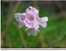
Flor de armeria