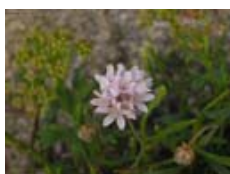
Armeria pubigera (herba de namorar)