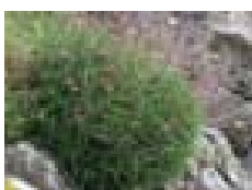
Armeria Pubigera (Portiño)