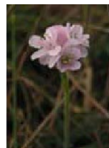
Armeria pubigera en Cabo Home