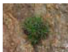
Herba de namorar en O Portiño