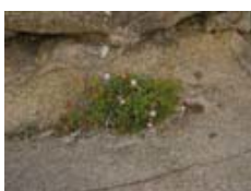
Armeria pubigera (herba de namorar)