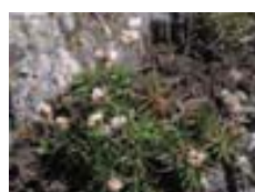
Armeria pubigera en la Isla de Ons