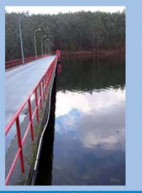
Encoro das Forcadas