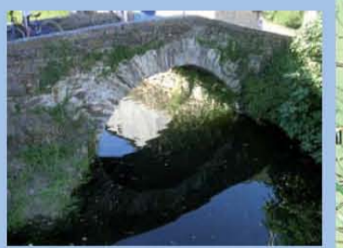
Capela da Fame